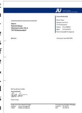
Vorlage für Briefe

Zentrales Element der spezifischen CI im Kreis Esslingen ist der blaue Querbalken aus dem Logo, der auf die volle Breite von Drucksachen, Homepages etc. erweitert wird und sich mit etwas Abstand zum Rand ganz oben auf jeder Seite